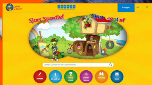
De website van Sjors